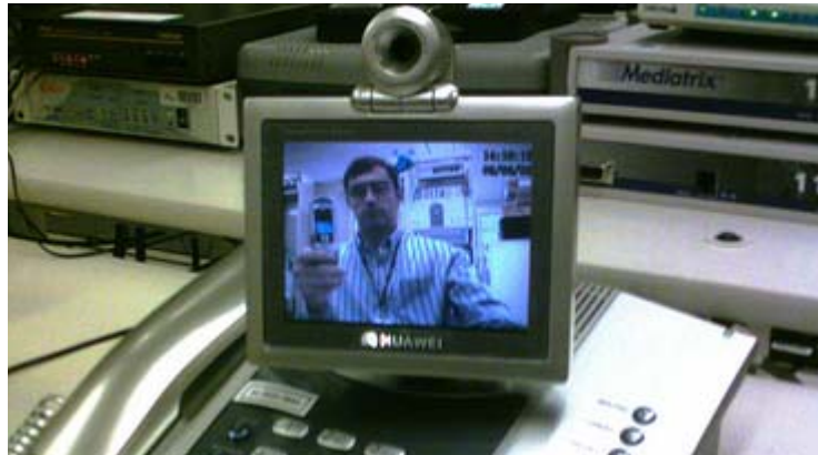
VoIP: Nutzer haben die Wahl zwischen Computer, Telefon oder Zwitterlösungen als Endgerät.

Ganze 95% dieser schnellen Internetzugänge basieren hierzulande auf DSL, in Zahlen, rund 14 Mio. Anschlüsse Ende Juni 2006 (Quelle: Portel.de).