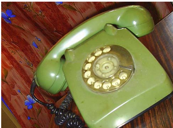
Anschlussfähig: In der Regel lassen sich vorhandene Endgeräte für die Internet-Telefonie weiter nutzen. Analogtelefone sind wie bei ISDN-Anschlüssen mit einer Wandlerbox anzubinden.